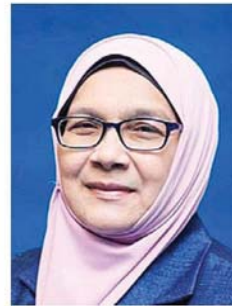
茜蒂玛丽亚：不清楚为何保留地进行清理工作。