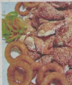
Roasted sesame chicken with Mongolian sauce and fresh onion rings.

The prawns were served on a bed of glutinous rice pops and aromatised with chopped, fried garlic. The trick behind the crispy rice is to dry the cooked grains completely before deep-frying. It is boiled and then baked at 30°C for 90