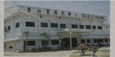
蒲種烏達瑪國小保留地用來興建華小，引起當地居民不滿，令霹靂培民華小計劃遷校至蒲種或生波。

“雪州宗教局是在2014年提出申请，教育部是去年，在未知土地已交付给宗教局下，申请兴建华小。这也表示，八打靈土地局和教育部之间在沟通上有所误会。教育部不知道土地已颁布