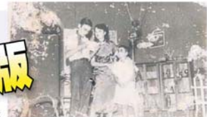
▲活动照片，图为50年代柔佛州《马来西亚华文话剧简史》收录多张珍贵的历史

详情可联系心向阳太阳剧坊016-2322693，电邮 https_theatre@yahoo.com ，或浏览“心向阳太阳剧坊”面书专页。