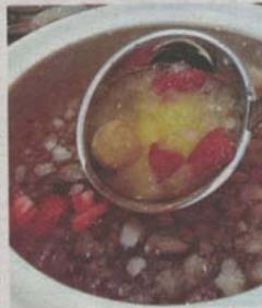
Chilled peach resin, aloe vera and dried longan soup.