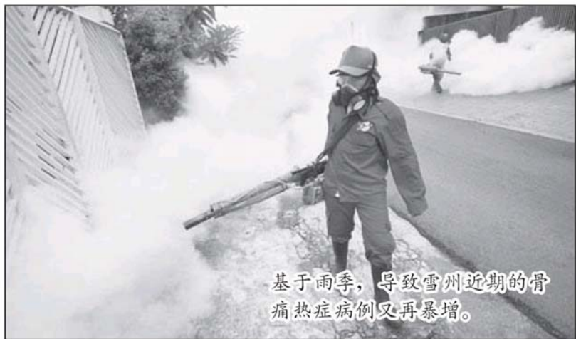
基于雨季，导致雪州近期的骨痛热症病例又再暴增。

她指出，当局预计，骨痛热症病例会在未来数周内，会继续增加。鉴于此，西蒂玛丽亚呼吁州内各地方政府、社区领袖及居民，关注自身住宅环境的卫生。