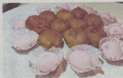
Fried nian gao with sweet potato and strawberry mochi.

minutes. It is then left to dry under an exhaust fan overnight.