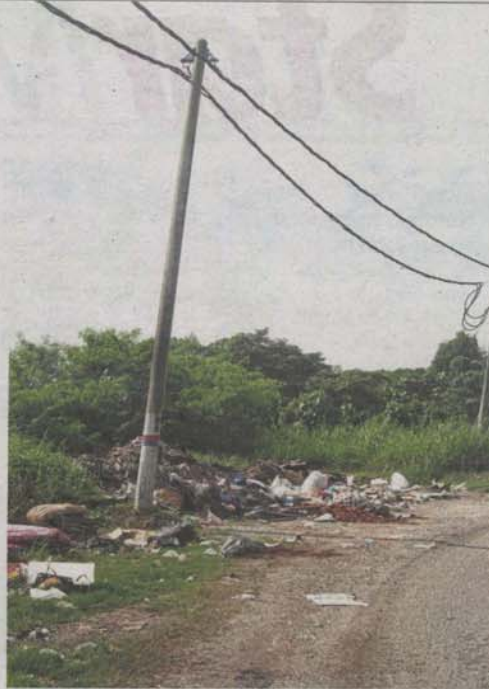
The burning of rubbish by unscrupulous parties on the roadside of Jalan Kebun Nenas in Klang had damaged the TNB cables above.

Elya said those who dumped waste illegally did so to avoid tipping fees at the Jeram landfill, where private contractors are charged RM55 for a one-tonne load.