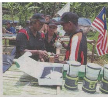
Sustainable impact: Veritas employees contributed to bringing solar lights into an orang asli settlement.