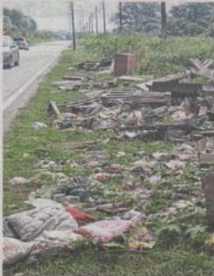
Broken furniture and construction debris are haphazardly strewn on the roadside.