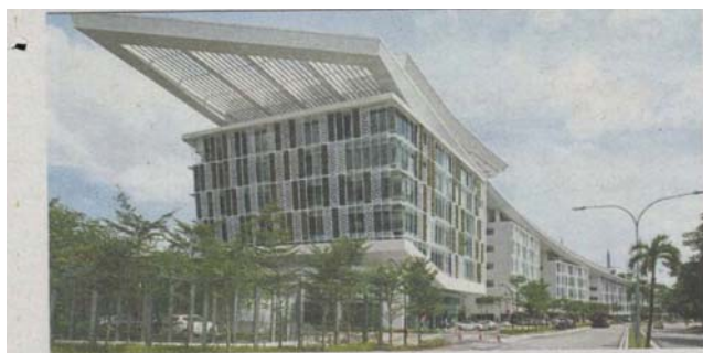
Green building: The award-winning Perbadanan Kemajuan Negeri Selangor (PKNS) headquarters in Shah Alam is a low-rise six-storey building capped by an ascending roof.

Provided for client's internal research purposes only. May not be further copied, distributed, sold or published in any form without the prior consent of the copyright owner.