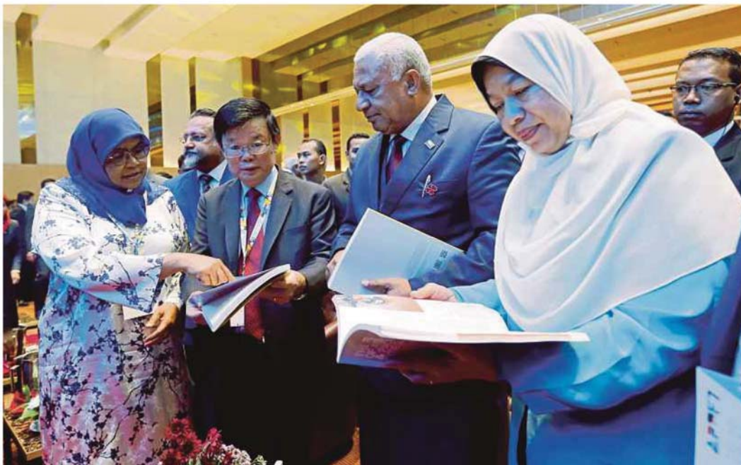
Fiji's Prime Minister Josaia Voreqe Bainimarama (second from right) looking at 'The Future of Asian and Pacific Cities' report at the Seventh Asia-Pacific Urban Forum in Bayan Baru in October. With him are Penang Chief Minister Chow Kon Yeow (second from left) and Housing and Local Government Minister Zuraida Kamaruddin (right). The report makes a case for the link between achieving sustainable development goals and the 'New Urban Agenda'.

The Penang Platform for Sustainable Urbanisation, a network of cities administrations, civil society organisations and other stakeholders, will help to "collaborate, integrate, transform and increase" the local ef-