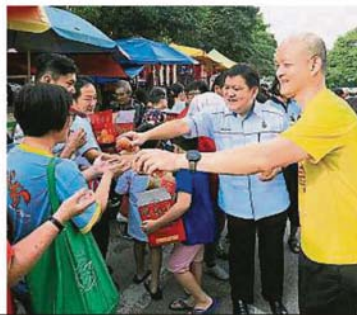
属于双溪龙社区一部分的双溪龙早市巴刹，已有20年的历史，前搬迁问题目前并没有新的进展。