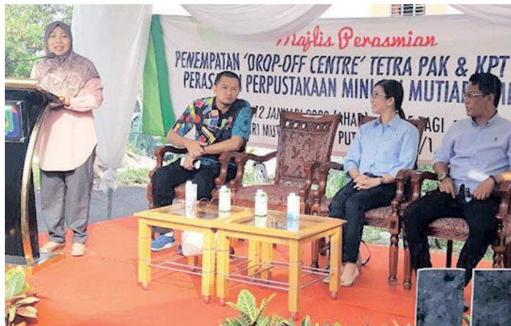
Noraini (kiri) ketika merasmikan Majlis Penempatan Pusat Kutipan Tetra Pak & KPT serta Perasmian Perpustakaan Mini Sri Mutiara MPSJ 2020 di Pangsapuri Sri Mutiara semalam.

“Tahun lalu kita melupuskan sebanyak 648 tan sampah dengan anggaran 1.9 kilogram sampah dihasilkan bagi setiap rumah,” katanya selepas merasmikan Majlis Penempatan Pusat Kutipan Tetra Pak & KPT serta Perasmian Perpustakaan