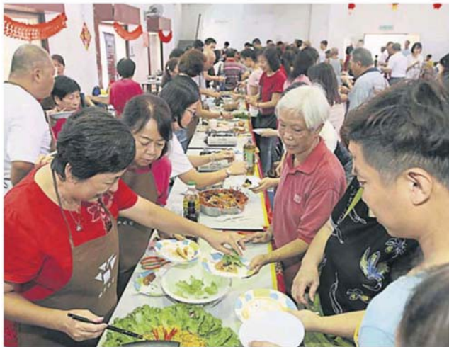
各式各样的美味年菜，吸引民众试吃。