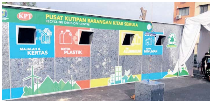
Penempatan pusat kutipan ini dilaksanakan bagi menggalakkan orang ramai menyertai program kitar semula barangan buangan secara maksimum.

Mini Sri Mutiara MPSJ 2020 di sini semalam.